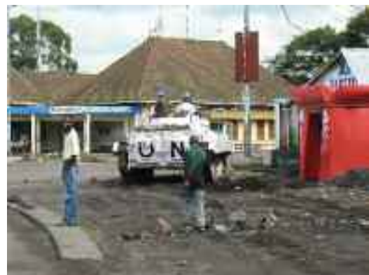
Pantserinfanterievoertuig van de VN-MONUC-missie in een straat in Goma, Democratische Republiek Congo.

In Burundi kregen oppositiepartijen het verbod om verkiezingsbijeenkomsten te houden. Er zijn meldingen van incidenten van pre-verkiezingsgeweld tussen leden van de regerende partij en de oppositiepartijen. In Rwanda hebben de autoriteiten de zeer ruim gedefinieerde wetgeving over genocidair ideologie gebruikt om mensen met afwijkende meningen het zwijgen op te leggen, onder meer bij critici van de regerende partij en bij diegenen die gerechtigheid eisen voor oorlogsmisdaden. Zoals in het verleden vreest Amnesty International voor vergelijkbare mensenrechtenschendingen ten aanzien van politieke tegenstanders in Oeganda. De ordehandhavers maken immers nu al gebruik van willekeurige arrestaties, onwettige detentie, foltering en andere mishandeling om verkiezingsbijeenkomsten en –campagnes te verhinderen. In Oeganda ligt ook een wetsontwerp voor om de regering uitgebreide macht te geven bij bewakingstaken.