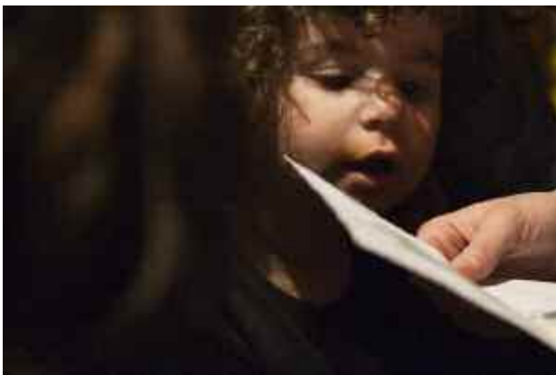
Ontheemde Roma uit Kosovo, verhuisd naar Belgrado net na het einde van het conflict in Kosovo in 1999.

De EU zou vanuit haar engagement voor de mensenrechten actie moeten ondernemen tegen de gedwongen uithuiszettingen, tegen het gescheiden onderwijs, de racistische aanvallen en het spuien van haat. Het Trio-voorzitterschap erkende de dimensie van fundamentele rechten en de nood om persoonlijke veiligheid en bescherming tegen discriminatie te verzekeren. EU-actie kan echter enkel vruchten afwerpen als die actie kadert binnen een omvattende en coherente strategie ter bevordering van de inclusie van Roma.