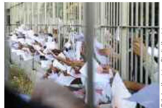
Asielzoekers wachtend om hun aanvraag in te dienen bij het Departement Politiek Asiel bij het Directoraat Vreemdelingenzaken, Athene, Griekenland.

Amnesty International verwacht van het Belgisch voorzitterschap dat het vooruitgang boekt in de oprichting van het Europees Asielondersteuningsbureau ( European Asylum Support Office , kortweg EASO). Dat bureau zal een centrale rol spelen in het streven naar een versterkte capaciteit van en een grotere solidariteit tussen de nationale asielstelsels. Het zal ook zorgen voor een gelijk niveau van bescherming in alle EU-Lidstaten. Het voorzitterschap moet ervoor zorgen dat alle betrokken stakeholders, met inbegrip van het middenveld, UNHCR, ngo's en andere onafhankelijke deskundigen, betrokken worden bij de ontwikkeling van dit bureau en een bijdrage kunnen leveren tot het werk van het bureau. Zo kunnen zij waken over de kwaliteit en efficiëntie van zowel de besluitvorming in asielzaken als de praktische samenwerking.